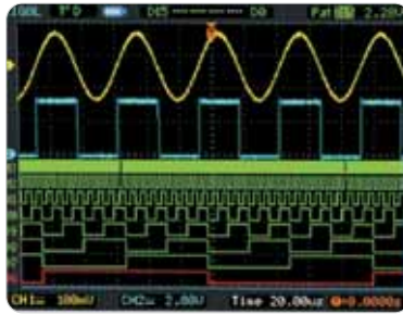
Déclenchement Pattern La condition de déclenchement est une combinaison de niveaux et de fronts