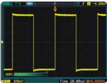
Intensité de la courbe réglable Permet un affichage personnalisé