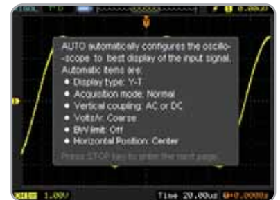
Système d'aide intégré Appuyer 3 secondes sur une touche pour accéder au menu d'aide