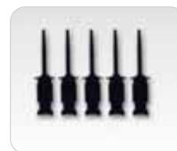
Pincettes pour analyse logique