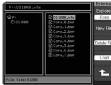
Système d'éditeur de fichiers Simple d'utilisation, permet l'utilisation de clés USB et la création de fichier de sauvegarde