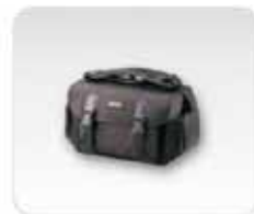
Sacoche de transport