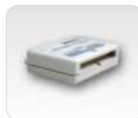
Module d'analyse logique