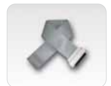
Câble de connexion pour module d'analyse logique