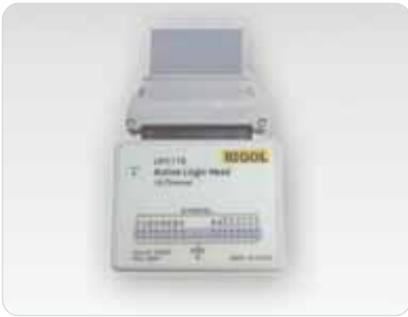
Module d'analyse logique

Les voies d'analyse logique sont divisées en deux groupes: D7-D0, D15-D8. Chacun travaille séparément.