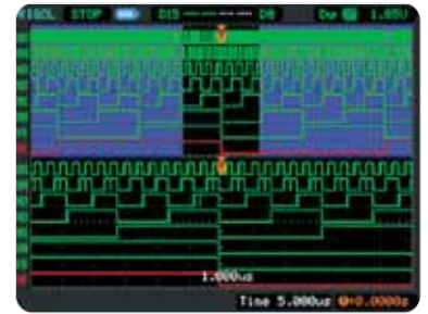
Déclenchement sur durée Combinaison de déclenchement Pattern et largeur d'impulsion